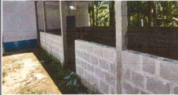
Foto1: COCINA: Falta completar las paredes.